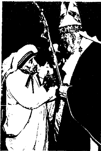
Mutter Teresa empfing 1997 bei ihrem letzten Papstbesuch noch einmal den Segen von Johannes Paul II. Sie war seine enge Vertraute. Experten vermuten den Großteil der Spenden auf der Vatikanbank

Mutter Teresa selbst sah es als ihr von Gott gegebenes Recht an, niemals zahlen zu müssen. Einmal kaufte sie in Lon-