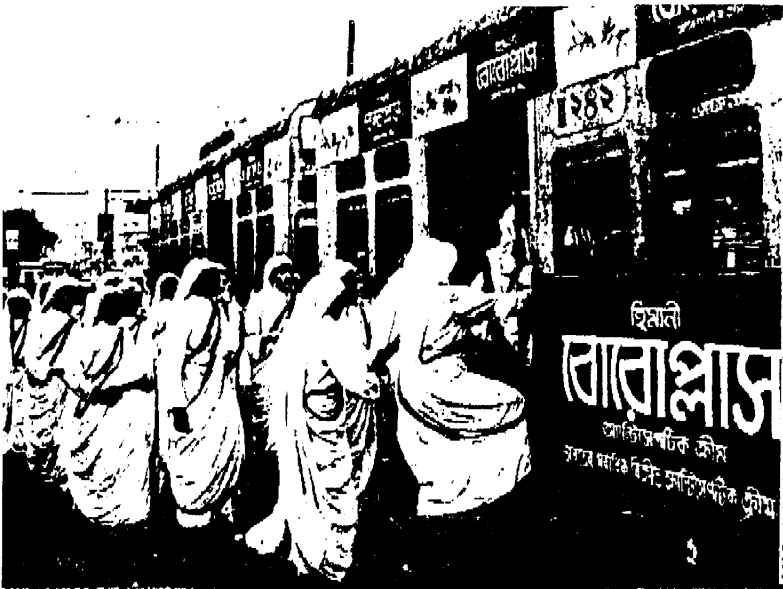
Missionarinnen der Nächstenliebe unterwegs in Kalkutta. Sie fahren kostenlos mit öffentlichen Verkehrsmitteln, weil Mutter Teresa es grundsätzlich ablehnte zu bezahlen. Dem mußten sich selbst Fluggesellschaften und Hotels beugen